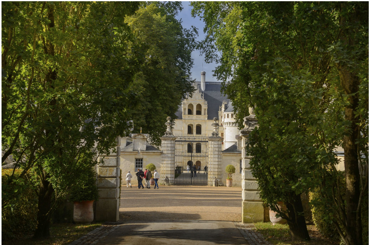
Château d'Azay-le-Rideau, façade de l'escalier vue depuis la grande grille