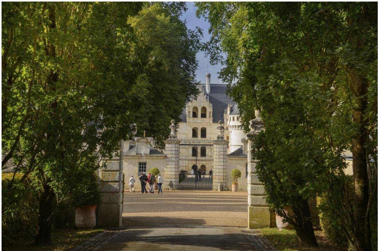
Château d'Azay-le-Rideau, façade de l'escalier vue depuis la grande grille

Contacts presse : Pôle presse du CMN : Marie Roy et Lauren Laporte 01 44 61 21 86 / 22 26 presse@monuments-nationaux.fr