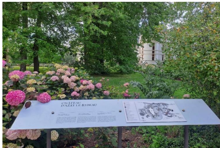
Plan tactile du monument

L'intérieur du château n'est pas accessible aux personnes en fauteuil. Des supports de médiation leur permettent de découvrir les parties inaccessibles du château dans l'ancien pressoir.