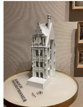
Écorché de l'escalier