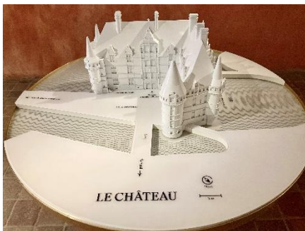
Maquette du château © Service culturel du château