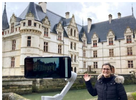
Visite en Live Stream