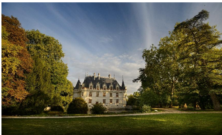
Le château et son parc paysager

Le Centre des monuments nationaux a fait de l'ouverture et de l'appropriation par tous les publics éloignés pour des raisons culturelles et socioéconomiques, un axe prioritaire de sa politique d'accueil. Détenteur de la marque Tourisme & Handicap depuis 2018, le château d'Azay-le-Rideau propose d'une part une offre variée d'activités animées par des médiatrices culturelles formées à l'accueil et aux besoins des publics spécifiques. D'autre part, le monument met à disposition des outils d'aide à la visite adaptés, permettant à tous les publics de s'approprier son histoire, ses collections et ses espaces dans les meilleures conditions.