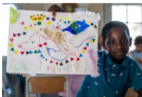
Atelier Drôles de bêtes