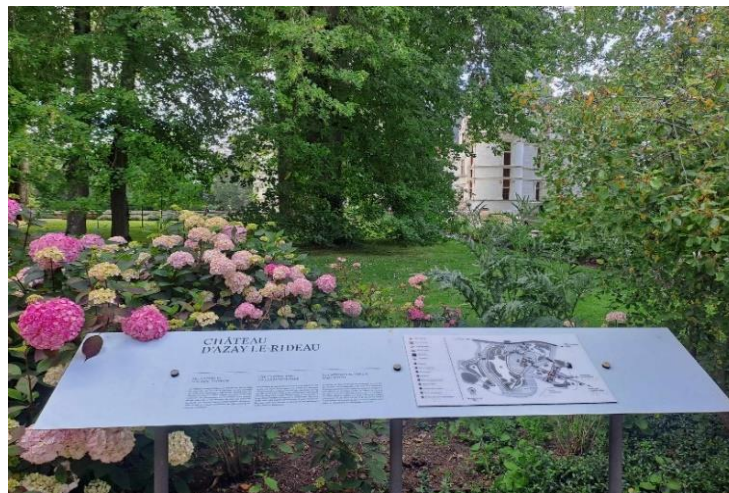
Plan tactile du monument

L'intérieur du château n'est pas accessible aux personnes en fauteuil. Des supports de médiation leur permettent de découvrir les parties inaccessibles du château dans l'ancien pressoir.