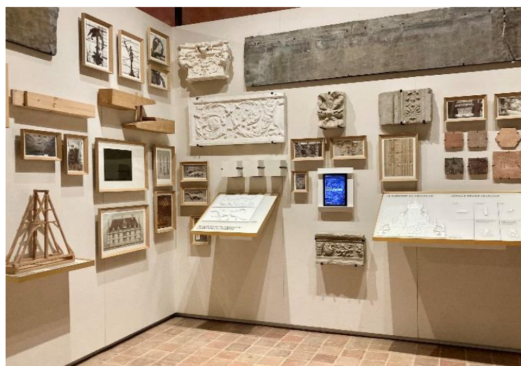
Dispositifs tactiles