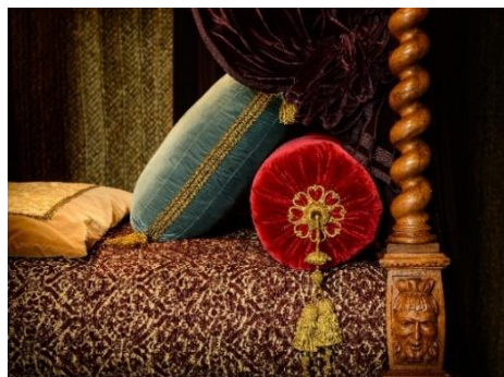
Chambre Renaissance

Bâti au cœur de la Touraine par Gilles Berthelot, financier du roi François I er , le château d'Azay-le-Rideau incarne la première Renaissance française : une subtile alliance de la tradition architecturale française et de décors innovants venus d'Italie. Édifié sur une île au milieu de la rivière de l'Indre, l'édifice est entouré d'un parc paysager du XIX e siècle dont des espèces d'arbres, considérées à l'époque comme étant exotiques, sont encore visibles à l'heure actuelle.