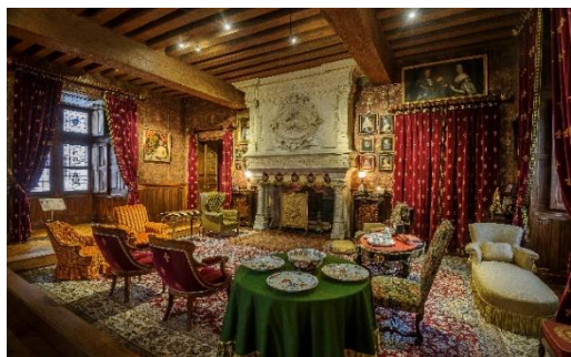
Salon des marquis de Biencourt

Propriété de l'État depuis 1905, le château a été remeublé avec du mobilier et des objets d'art de différentes époques qui ont permis de restituer les décors des appartements tels qu'ils étaient du temps de ses anciens propriétaires. L'édifice est géré par le Centre des monuments nationaux, établissement public national sous tutelle du ministère de la Culture qui conserve, restaure et ouvre à la visite plus de 100 monuments historiques nationaux.