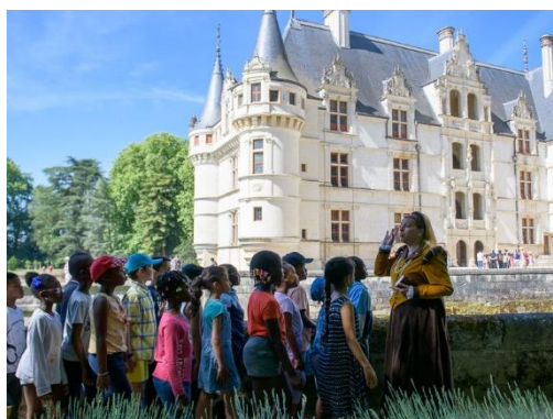
Visite Philomène

Tarif par accompagnateur supplémentaire : 13,00 €