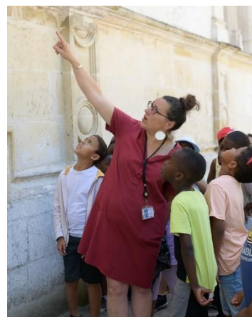
Atelier Drôles de bêtes © François Christophe

Nous vous recontacterons ensuite dans les meilleurs délais. Dès confirmation de votre réservation, vous recevrez un document à présenter le jour de votre venue en billetterie accompagné de votre mode de règlement.