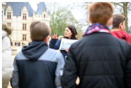
Visite conduite par une médiatrice