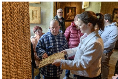
Visite sensorielle

Contact : joanna.labussiere@monuments-nationaux.fr