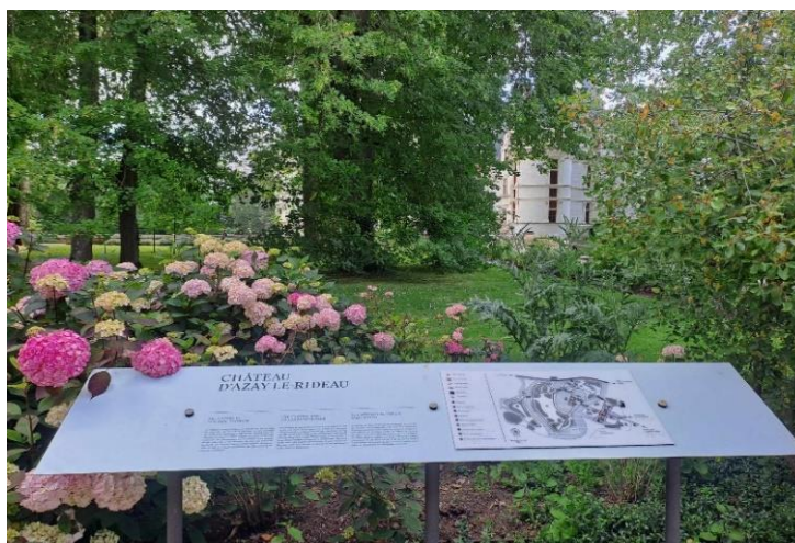
Plan tactile du monument

L'intérieur du château n'est pas accessible aux personnes en fauteuil. Des supports de médiation leur permettent de découvrir les parties inaccessibles du château dans l'ancien pressoir.