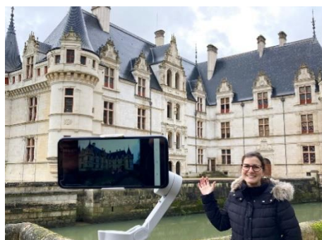
Visite en Live Stream