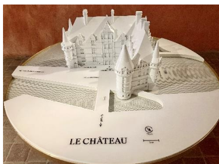
Maquette du château