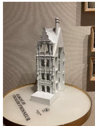
Écorché de l'escalier