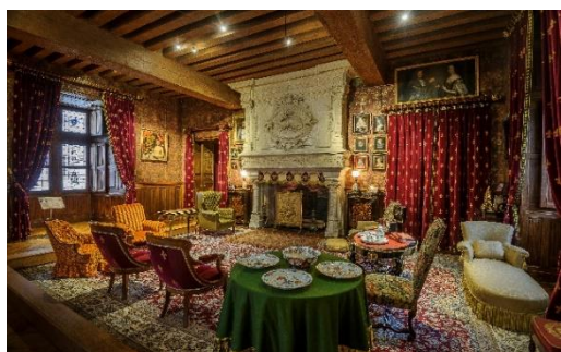
Salon des marquis de Biencourt

Propriété de l'État depuis 1905, le château a été remeublé avec du mobilier et des objets d'art de différentes époques qui ont permis de restituer les décors des appartements tels qu'ils étaient du temps de ses anciens propriétaires. L'édifice est géré par le Centre des monuments nationaux, établissement public national sous tutelle du ministère de la Culture qui conserve, restaure et ouvre à la visite plus de 100 monuments historiques nationaux.