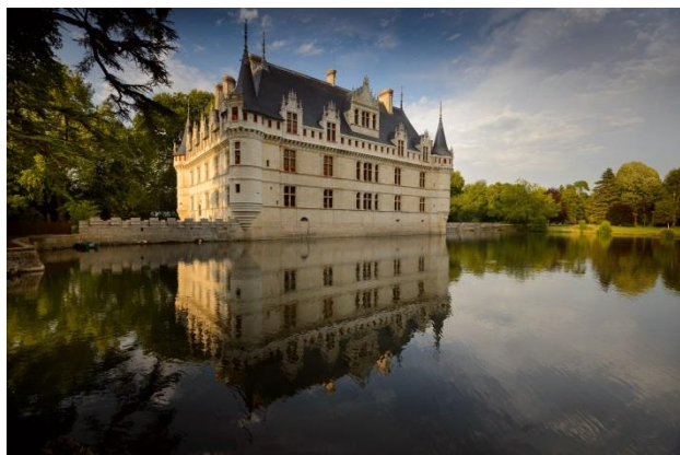
Château d'Azay-le-Rideau © Léonard de Serres – CMN

Symbole inscrit dans l'imaginaire collectif, en France comme à l'étranger, avec son reflet sur le miroir d'eau, le château d'Azay-le-Rideau est un chef-d'œuvre d'architecture. Subtile alliance de traditions françaises et de décors innovants venus d'Italie, il est une icône du nouvel art de bâtir dans le Val-de-Loire au XVI e siècle.