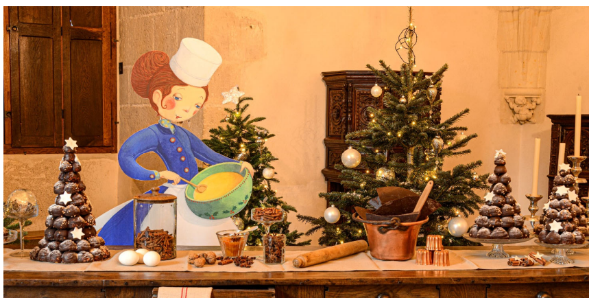
Photo d'une édition précédente