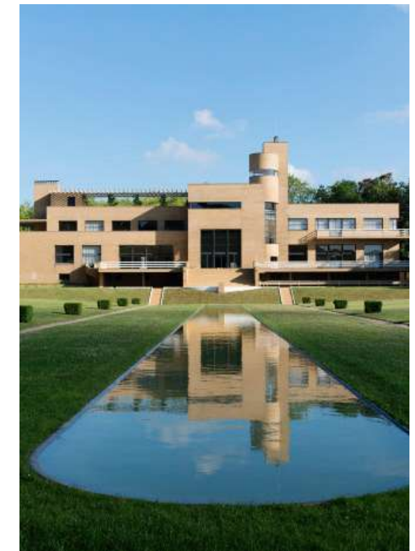
Villa Cavrois à Croix (59)