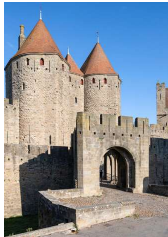
Château et remparts de la Cité de Carcassonne (11)