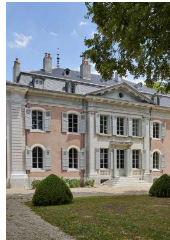
Château de Voltaire à Ferney (01)