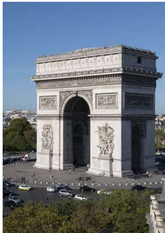
Arc de Triomphe à Paris (75)

Tous illustrent par leur diversité, la richesse du patrimoine français de toutes les époques : abbayes, châteaux, grottes préhistoriques, sites archéologiques... Opérateur du tourisme culturel unique par sa dimension nationale et la force de son réseau, le Centre des monuments nationaux est un partenaire patrimonial indispensable pour tous les professionnels du tourisme.